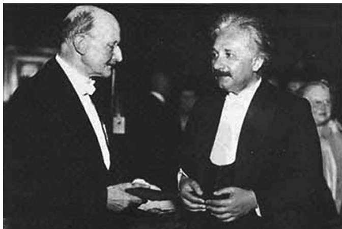
Max Karl Ernst Ludwig Planck (23. 8. 1858 - 4. 10. 1947) a Albert Einstein (14. 3. 1879 - 18. 4. 1955) v Berlíně při předávání medaile Maxe Plancka, 28. 6. 1929

V centru dalšího lékařského vzdělávání a řízení kvality