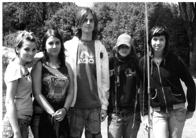
Tým skeptických studentů gymnázia v Kyjově